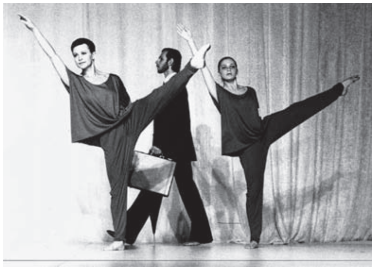
Die »Iwanson Company« im Jahr 1981