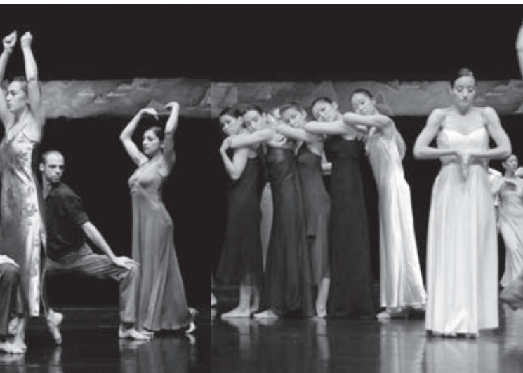
oben links: »Evolving« (Choreographie: Rodolpho Leoni) oben rechts: »Fearfull Symmetries« (Choreographie: Mark Sieczkarek) unten: »Lichtung« (Choreographie: Stephan Brinkmann)

als Minihügel in die Landschaft. Brinkmann bildet und verteilt souverän und immer wieder überraschend Unisono-Gruppen, variiert die Dynamik von dösig bis nervös, und die Raumhöhe von Liegen bis Stehen und Hüpfen. Im Tanzfluss der Arm- und Körperschwünge der Bodengleiter, Rollen, Sprünge und Contact Stützen und -Hebungen lässt er die Tänzer zur freundlichen Weltmusik von Armand Amar das Übliche des Modern-Stils präsentieren. Eine Sprache, die die Tänzer, alle in beige-braun gekleidet, denn auch alle fließend zu sprechen gelernt haben.