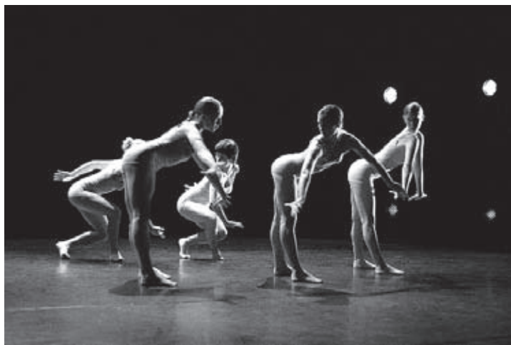
Studenten des 7. und 8. Semesters (Choreographie Jacopo Godani)

bei der simplen Fortbewegung erreichen. Beim Tanzen geht es zum Glück um mehr als bloßes Vorwärts; außer bei der Ausbildung. Der Frankfurter Tanzmarathon ist seit vier Jahren eine Art Endsprint vor dem Zieleinlauf in die Semesterferien. Oder ins Berufsleben. Er ist pro Saison das dritte Programm der Tanzabteilung ZuKT der Hochschule für Musik und Darstellende Kunst (neben Auftritten diesmal in Berlin bei der 1. Biennale Tanzausbildung, in Kassel und beim Festival Frankfurter Positionen) und der längste. Seine Vielfältigkeit steht für die dortige Ausbildung von K bis Z, Klassisch bis Zeitgenössisch. Beim 2008er-Rennen sind alle 26 tanzenden Beteiligten prima angekommen. Fast alle traten mehrfach auf, einige vielfach.